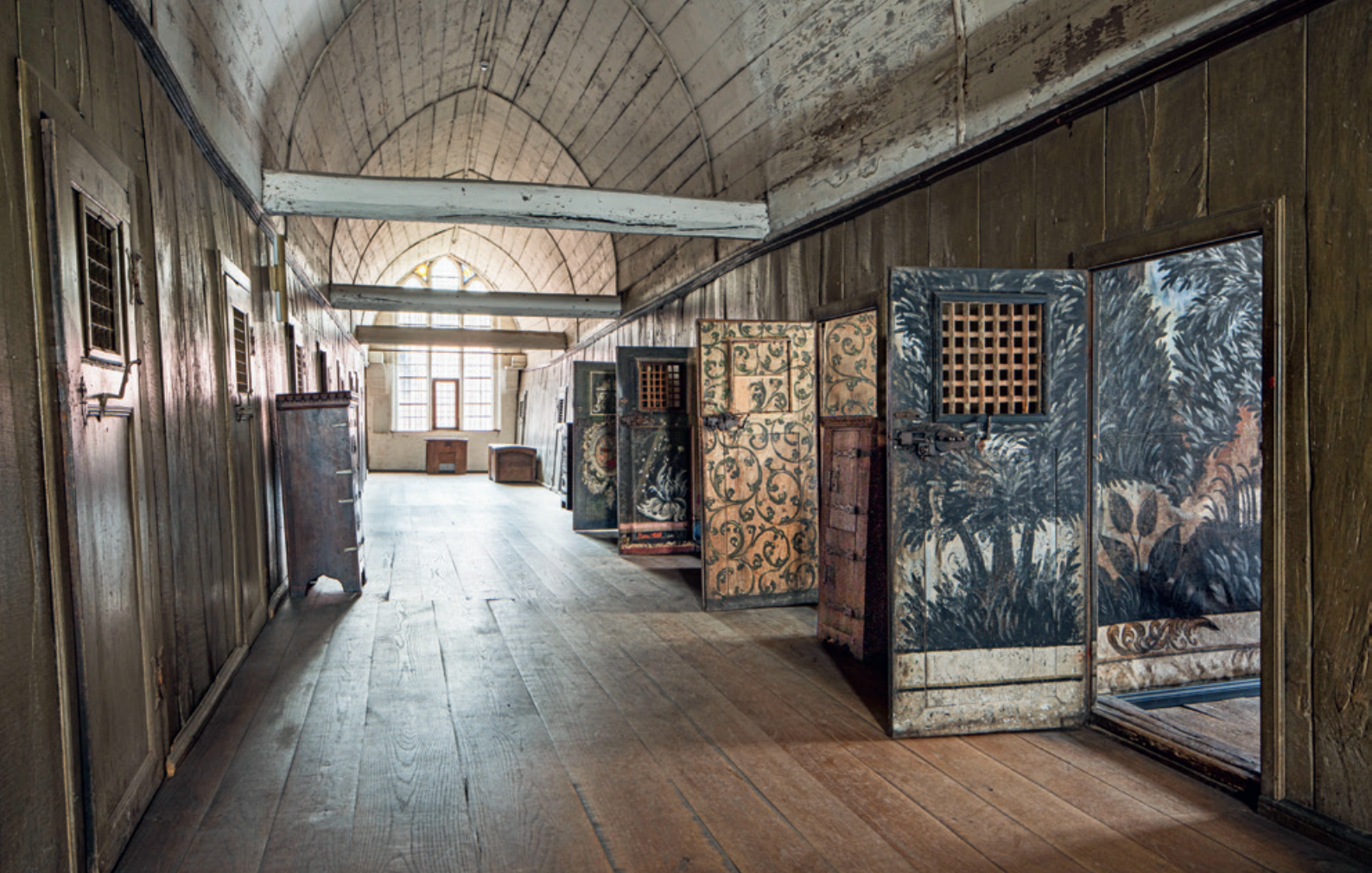
Die bemalten Türen der ehemaligen Klosterzellen im Kloster Lüne bei Lüneburg zeigen Malereien, die an den Wänden der Zellen fortgeführt werden.