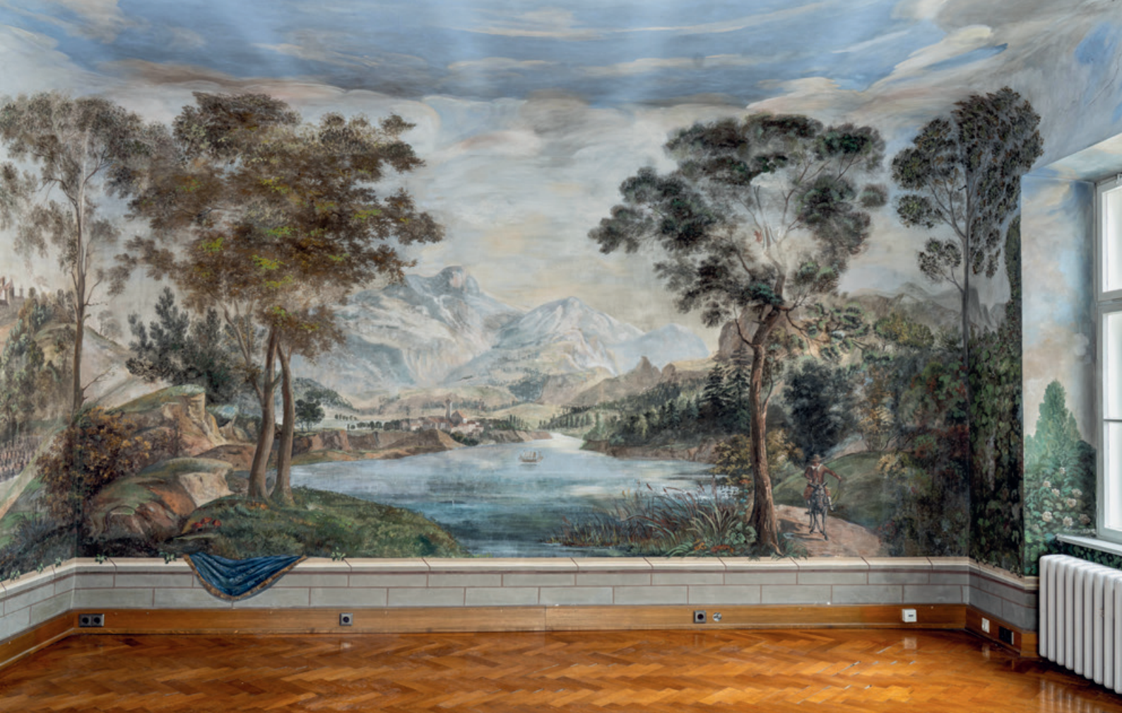
Barocke Wand- und Deckenmalerei im Pflegehaus in Mindelheim, das Anfang des 18. Jahrhunderts erbaut wurde und als Verwaltungs- und Wohngebäude diente.

Außenaufnahmen der Einsatz einer Drohne zum Programm. Wie bei Schloss Solitude in Stuttgart oder Kloster Lüne bei Lüneburg können so die Dimensionen größerer Bauensembles erfasst oder schwer zugängliche Gebäude fotografiert werden, etwa Schloss Schillingsfürst, das an einem Berghang liegt.