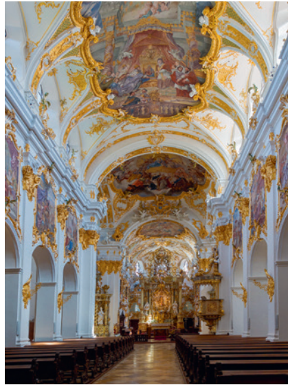
S. 42 | Eine Neuerscheinung dokumentiert die Inschriften der Alten Kapelle Regensburg.

für eine digitale Gesellschaft In der Schule müssen digitale Grundkompetenzen vermittelt werden